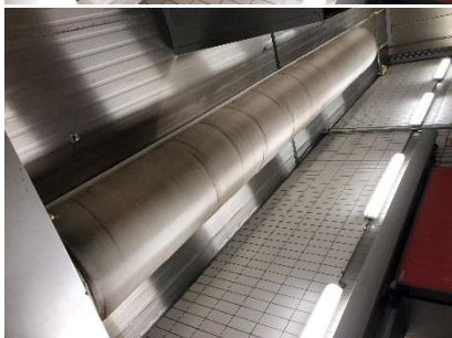
2 gaines textile D1000 de 15 ml 3 gaines textile D1000 de 8 ml au total