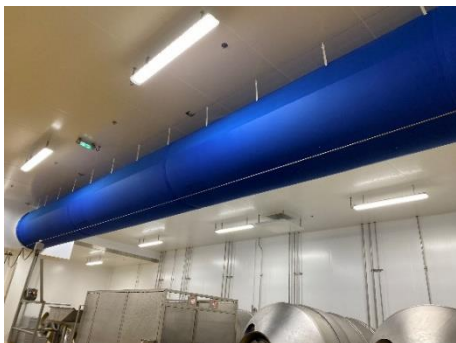
1 gaine textile D1250 de 20 ml Hauteur : 5m