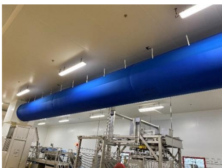
1 gaine textile D1250 de 15 ml Hauteur : 5m accès nacelle ok